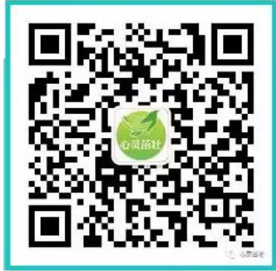
深圳市反邪教微信公众号